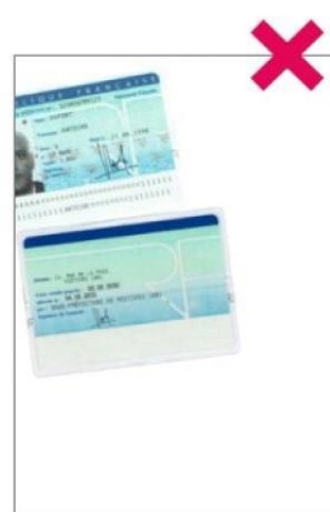
Carte d'identité tronquée