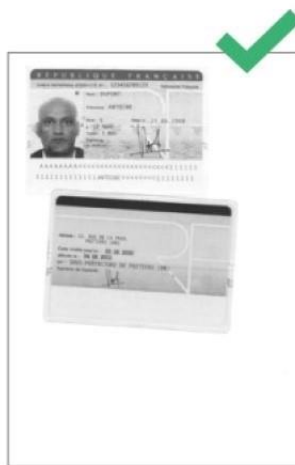
Noir et blanc