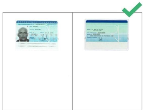
Recto et verso sur un même document PDF