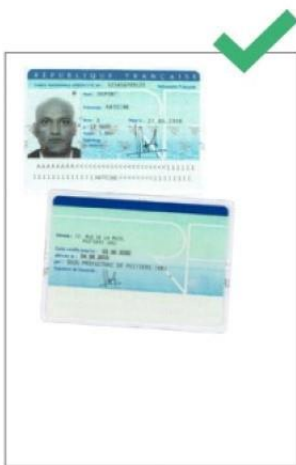
Carte d'identité lisible

Veillez à ce que votre copie soit lisible, non tronquée, bien cadrée et n'oubliez pas de scanner le verso du document (carte d'identité) ou la page sur laquelle figure votre signature (passport).