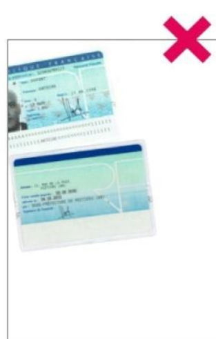
Carte d'identité tronquée